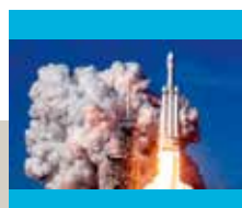
De toekomst van de ruimtevaart - lezing op 22 oktober - blz. 24