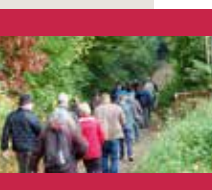
Tijd om de kortenbergse trage wegen te ontdekken - blz. 5