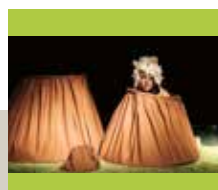
Familievoorstelling Vulkan in de Bib op 17 oktober - blz. 24