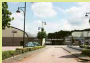
Sporthal en GC Colomba Wijngaardstraat 1 3070 Kortenberg