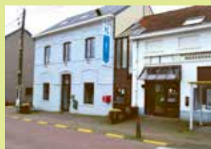
OC Atrium Dorpsstraat 177 3078 Meerbeek