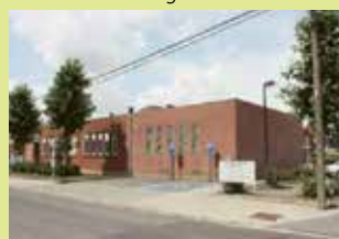
OC Berkenhof Beekstraat 25 3070 Kortenberg