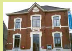
OC Oud Gemeentehuis Gemeentehuisstraat 11 3078 Everberg