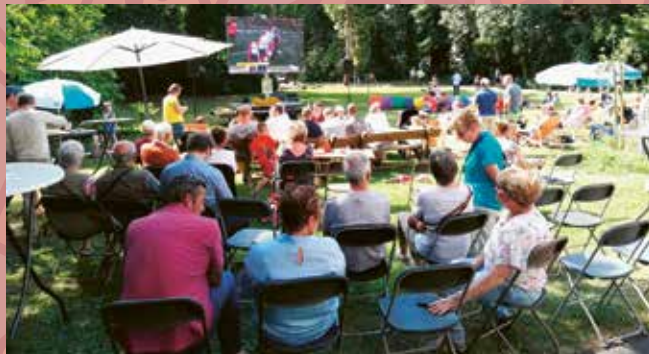
Gezelligheid troef tijdens de eerste Zomerse Parkdag op zondag 7 juli met rechtstreekse uitzending van de Tour de France op groot scherm.