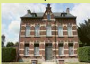
Erfgoedhuis Dorpsplein 16 3071 Erps-Kwerps