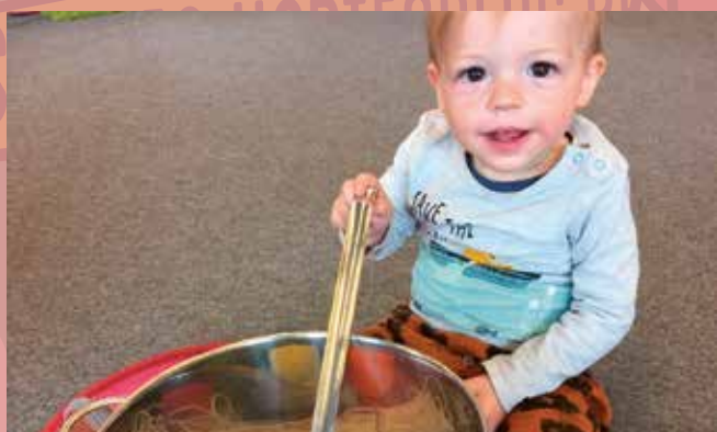
Ook de allerkleinsten konden in de Bib een hele zomer lang meedoen met het nieuwe 'Schatjes van Vlieg'- parcours.