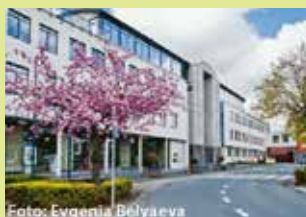
Administratief Centrum Dr. V. De Walsplein 30 3070 Kortenberg