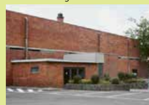
Polyvalente zaal Erps-Kwerps Oude Baan 14 3071 Erps-Kwerps