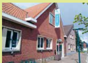
OC De Zolder Kwerpsebaan 251 3071 Erps-Kwerps