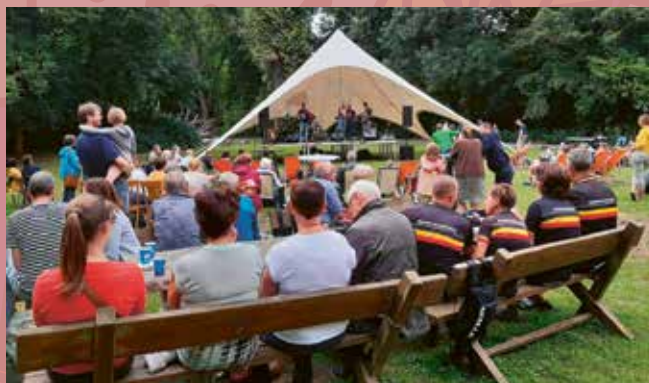
De Rammenas gaven het beste van zichzelf tijdens de Zomerse Parkdag van 14 juli. Hun Nederlandstalige covers zorgden voor veel ambiance!