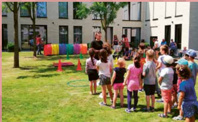
De Bib altijd en overal! Tijdens de Bib on Tour wisten de voorlezers enkele unieke plekken in Kortenberg uit te zoeken en zo bezorgden ze vele kindjes een fantastische namiddag.