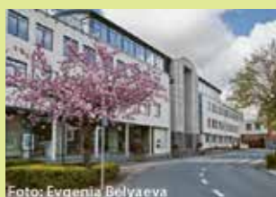
Administratief Centrum Dr. V. De Walsplein 30 3070 Kortenberg