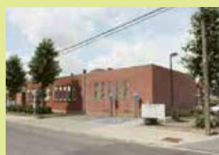
OC Berkenhof Beekstraat 25 3070 Kortenberg