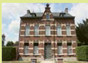
Erfgoedhuis Dorpsplein 16 3071 Erps-Kwerps