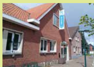
OC De Zolder Kwerpsebaan 251 3071 Erps-Kwerps