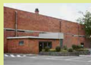
Polyvalente zaal Erps-Kwerps Oude Baan 14 3071 Erps-Kwerps