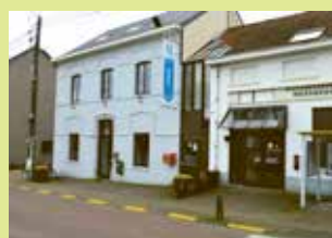
OC Atrium Dorpsstraat 177 3078 Meerbeek