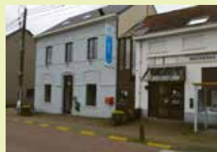
OC Atrium Dorpsstraat 177 3078 Meerbeek