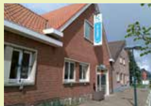
OC De Zolder Kwerpsebaan 251 3071 Erps-Kwerps