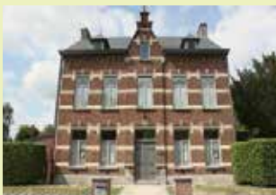
Erfgoedhuis Dorpsplein 16 3071 Erps-Kwerps