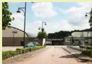
Sporthal en GC Colomba Wijngaardstraat 1 3070 Kortenberg