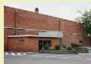
Polyvalente zaal Erps-Kwerps Oude Baan 14 3071 Erps-Kwerps