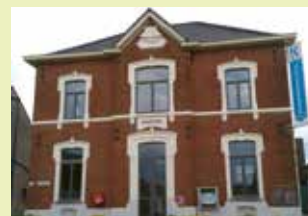
OC Oud Gemeentehuis Gemeentehuisstraat 11 3078 Everberg