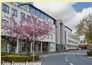
Administratief Centrum Dr. V. De Walsplein 30 3070 Kortenberg