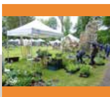
Kringlooptuindag en plantenbeurs op zondag 27 mei van 10 tot 17 u. in het Park van de Oude Abdij