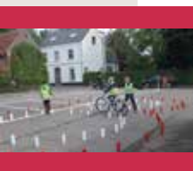
Opgelet: levend verkeerspark voor de Kortenberqse schoolkinderen