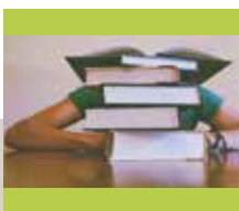
Kom studeren in de Bib vanaf 28 mei - info op blz. 19