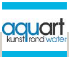
Aquart - kunst rond het thema water in het Park van de Oude Abdij vanaf 13 mei