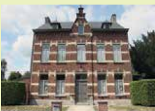
Erfgoedhuis Dorpsplein 16 3071 Erps-Kwerps