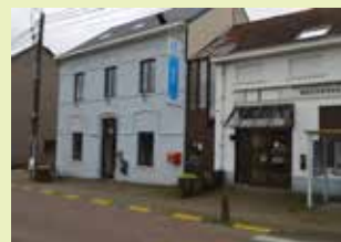
OC Atrium Dorpsstraat 177 3078 Meerbeek