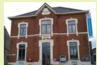
OC Oud Gemeentehuis Gemeentehuisstraat 11 3078 Everberg