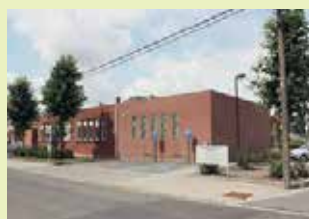
OC Berkenhof Beekstraat 25 3070 Kortenberg