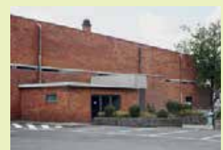
Polyvalente zaal Erps-Kwerps Oude Baan 14 3071 Erps-Kwerps