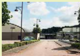
Sporthal en GC Colomba Wijngaardstraat 1 3070 Kortenberg