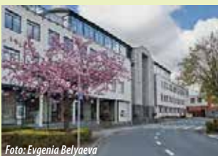
Administratief Centrum De Walsplein 30 3070 Kortenberg