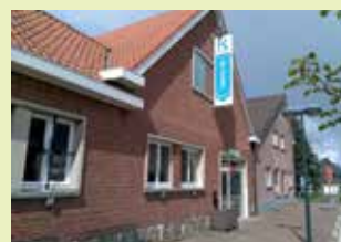
OC De Zolder Kwerpsebaan 251 3071 Erps-Kwerps