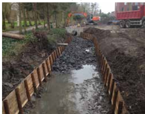
1. Uitvoering oeverversteving

Een eerste ingreep werd uitgevoerd op de Weesbeek en de vijver gelegen achter het rust- en verzorgingstehuis O.L.Vrouw van de Zwarte Zusters. De Weesbeek werd hier opnieuw geprofileerd en voorzien van een nieuwe oeverversteving.