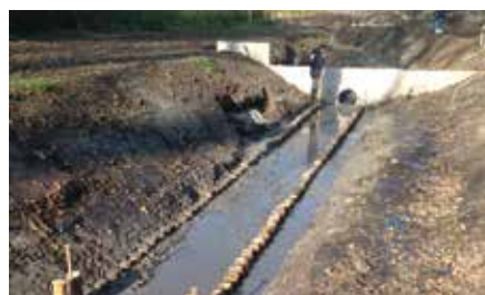
2. Oeverversteving en winterbedding