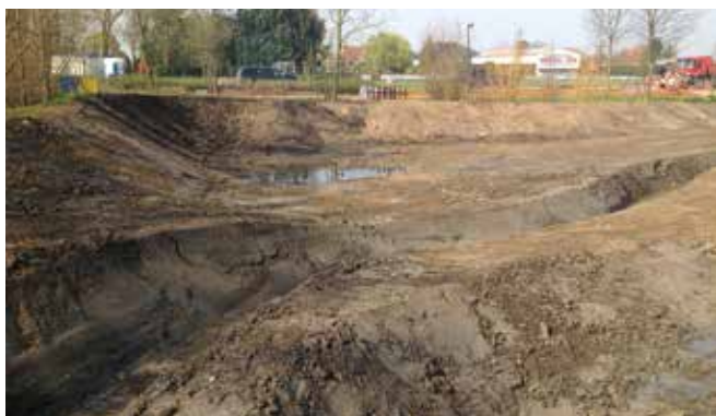
2. Open Weesbeek met zomer- en winterbedding