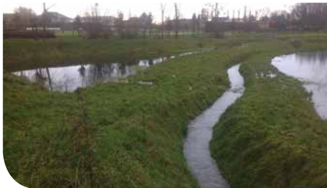
3. Weesbeek met deels gevulde winterbedding