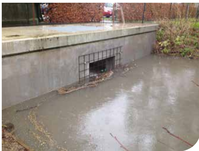
4. Overstort in werking