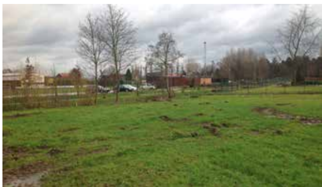
1. Terrain met ingebuisde Weesbeek

Ter hoogte van Hof ter Bruggen op de terreinen gelegen langs de voetbalvelden van Erps-Kwerps werd een tweede ingreep voorzien op de Weesbeek. Op deze terreinen was de Weesbeek voor een groot gedeelte ingebuisd. De Weesbeek werd op dit terrein terug opengelegd en voorzien van een winterbedding. Bij gewone weersomstandigheden stroomt de beek hier in haar gewone bedding, wanneer er hevige regenval komt kan de beek buiten haar oevers treden en de winterbedding gaan opvullen. In deze winterbedding kan een groot gedeelte water gebufferd worden en nadien traag afgevoerd worden of infiltreren in de bodem. Wanneer de winterbedding helemaal opgevuld is, ontstaat er hier ook als het ware een grote vijver.