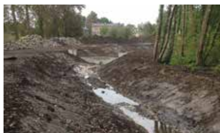
1. Nieuw tracé van de waterloop

Naast de nieuwe waterloop werd er ook een fiets- en wandelpad aangelegd dat aansluit op de bestaande trage wegen.