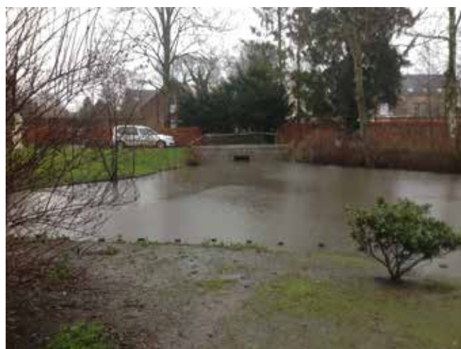
3. Maximale buffering op vijver

Tevens werd er op de vijver gelegen achter het rust- en verzorgingstehuis een nieuwe overstortconstructie gebouwd. Ook deze constructie heeft tot doel de buffercapaciteit van de vijver maximaal te benutten. Eenmaal deze buffercapaciteit bereikt zal het water wegstromen via een overstort. Hierbij wordt het uitgangsdebiet groter dan het debiet aan inkomend water zodat er ook in deze tuin geen wateroverlast kan zijn. Door deze vroege buffering stroomopwaarts is de kans op wateroverlast op de afwaarts gelegen stukken van de Weesbeek kleiner. Na een hevige regenbui zal de vijver dan rustig verder leeglopen tot zijn natuurlijk niveau.