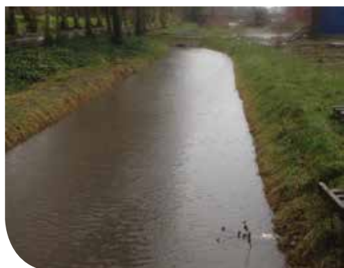
2. Huidige buffercapaciteit na regenbui

Tevens werd er op de vijver gelegen achter het rust- en verzorgingstehuis een nieuwe overstortconstructie gebouwd. Ook deze constructie heeft tot doel de buffercapaciteit van de vijver maximaal te benutten. Eenmaal deze buffercapaciteit bereikt zal het water wegstromen via een overstort. Hierbij wordt het uitgangsdebiet groter dan het debiet aan inkomend water zodat er ook in deze tuin geen wateroverlast kan zijn. Door deze vroege buffering stroomopwaarts is de kans op wateroverlast op de afwaarts gelegen stukken van de Weesbeek kleiner. Na een hevige regenbui zal de vijver dan rustig verder leeglopen tot zijn natuurlijk niveau.