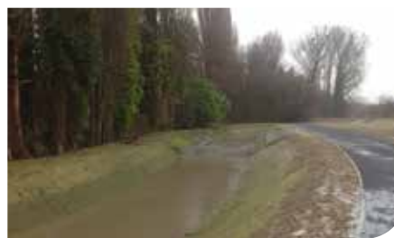
3. Buffering op de Weesbeek afwaarts Kasteelstraat