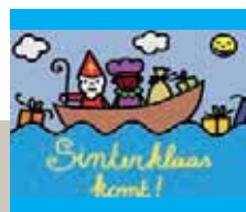
Sinterklaas in de Bib op 3 december