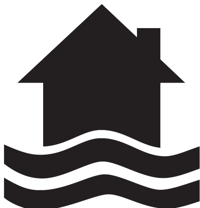
In advertenties herkent u vastgoed in overstromingsgevoelig gebied aan dit symbool.

Elke woensdag tussen 9 en 12 u. en 13 en 16 u. kunt u langskomen tijdens het spreekuur op de dienst Ruimtelijke Ordening in het Administratief Centrum (De Walsplein 30).