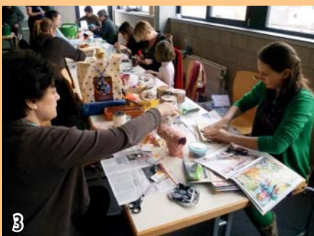
SONY DSC