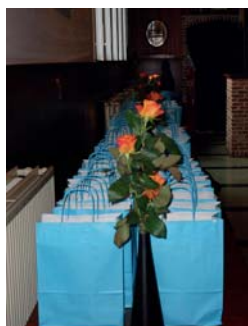
Een kleine attentie die de vrijwilligers tijdens het vorige vrijwilligersfeest ter bedanking mochten ontvangen.

De sociale dienst van het OCMW is geopend op maandag-, dinsdag-, donderdag- en vrijdagvoormiddag van 9 tot 11.45 u. Ook op maandagavond van 17 tot 19 u. is er permanentie. OCMW Kortenberg, De Walsplein 30, Kortenberg socialedienst@ocmwkortenberg.be , 02 755 23 25 Meer info: www.ocmwkortenberg.be