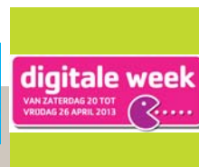
Verneem alles over de Digitale Week 2013 in Kortenberg