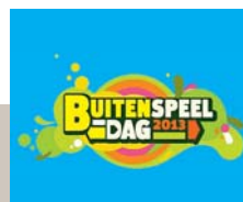
Buitenspeeldag op 27 maart