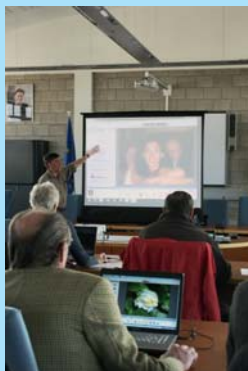
Photo Story 3 voor Windows van Microsoft kan gratis worden gedownload van het internet. Na de installatie leert u foto's importeren en bewerken. U leert titels en effecten invoegen, commentaar of muziek toevoegen en zoomeffecten toepassen. De show wordt opgeslagen en aangepast om af te spelen met Windows Media Player. Daarna leert u hoe u alles op dvd of cd-rom brandt om de fotoshow af te spelen op uw tv.