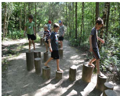
352-fuif en Toernee General.

Ook in 2016 konden de drie jeugdverenigingen rekenen op financiële ondersteuning voor de jeugdkampen, onder de vorm van kampsubsidies, subsidies voor de aankoop van veiligheidsmateriaal en subsidies voor voedselveiligheid en vervoersubsidies.