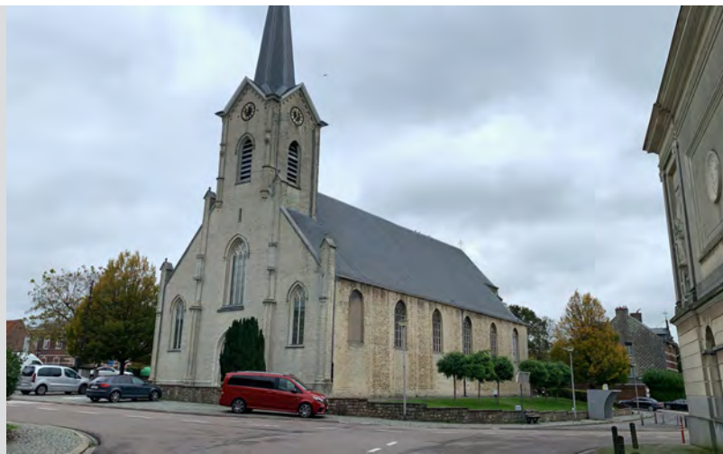
foto: Dorpskern Erps

“In Kortenberg kiezen we ervoor om onze gemeente op een duurzame manier uit te bouwen.”