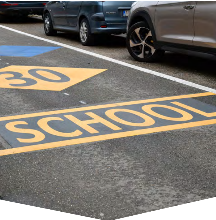
foto: Thermoplast sticker school Mater Dei

Politie, scholen, gemeenschapswachten en vrijwilligers zorgen samen voor een verkeersveilige schoolomgeving . Om de acties en werking in goede banen te leiden, zetten we een coördinatieorgaan op tussen de verschillende partijen. Alle info over deze werking verspreiden we via Zoeklicht, de website en communicatie via de scholen.