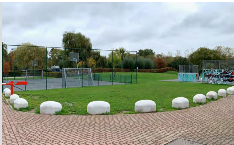
foto: Voetbalpleintje & skatepark

“Aandacht hebben voor anderen. Elkaar aanspreken op mogelijkheden. Uit respect. Zo gaan we samen vooruit.”