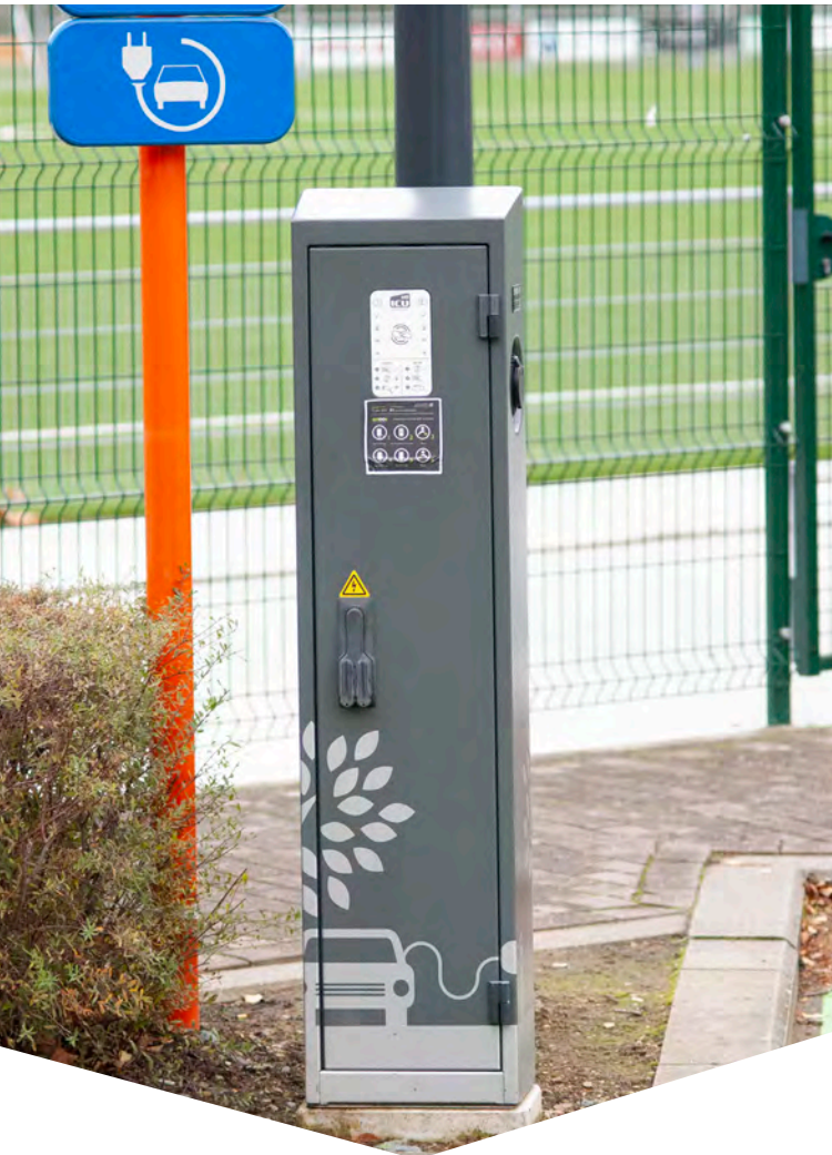
foto: Laadpaal parking Colomba

Kortenberg is rijk aan voet-, buurt- en andere trage wegen. Die kleine wegen en paden tussen akkers en tuinen zijn meestal toegankelijk voor fietsers en voetgangers, maar niet voor auto's. We willen ze optimaal onderhouden en waar mogelijk verder uitbreiden. Ook onderzoeken we de mogelijkheid om verlichting te installeren op de trage wegen die leerlingen gebruiken om naar school te gaan. Ook het onderzoek naar de heraanleg van de N2 staat op het programma.