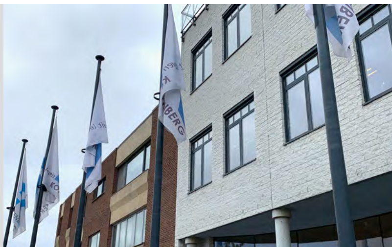
foto: Vlaggen voor het administratief centrum

“Een optimale dienstverlening is een continu werk in ontwikkeling waarvoor we de juiste mensen, middelen en methodes inzetten.”