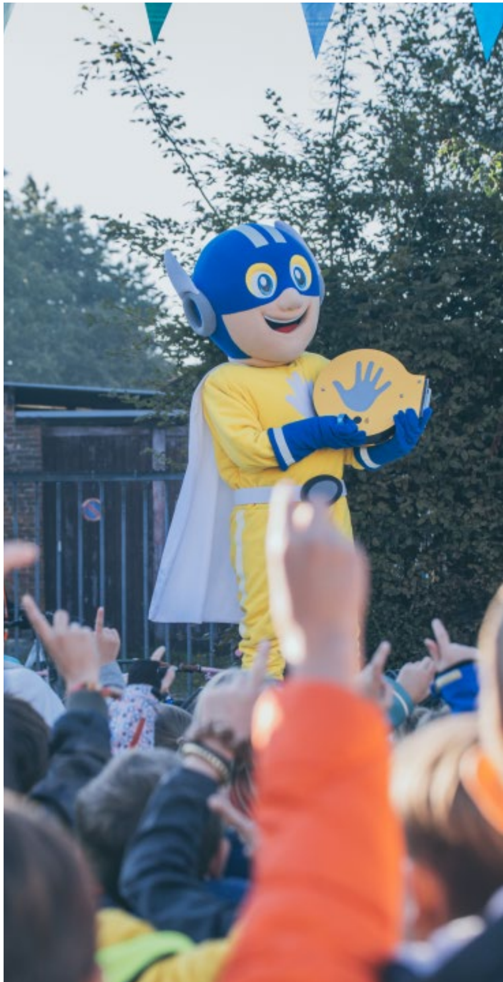
Op donderdag 22 september kwam mascotte 'Five' langs bij Mater Dei en De Klimop.