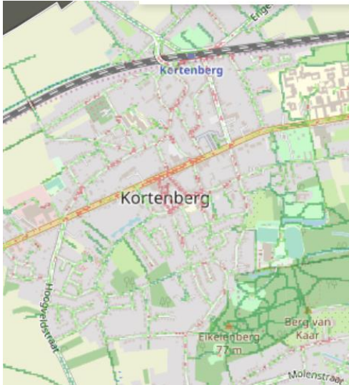
Kaart B :