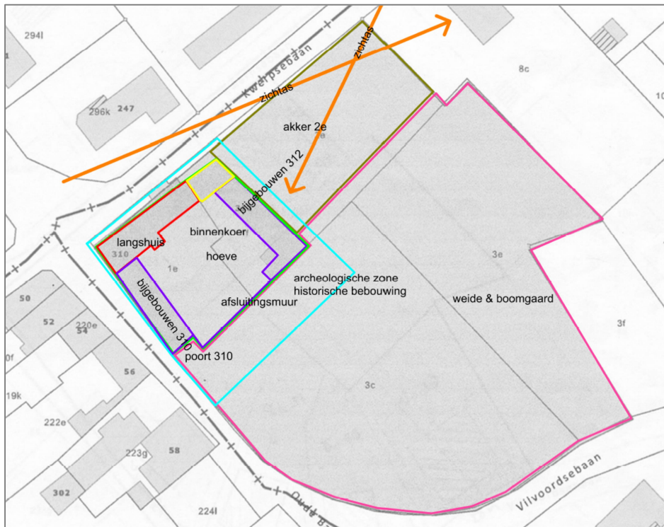
Plan "Preadvis Geck! 07/05/2014". (Onderkaart: AGIV)

7 Het verder aftoetsen van de plannen met de Geck! o.b.v. inrichtingsschets(en) en overleg.