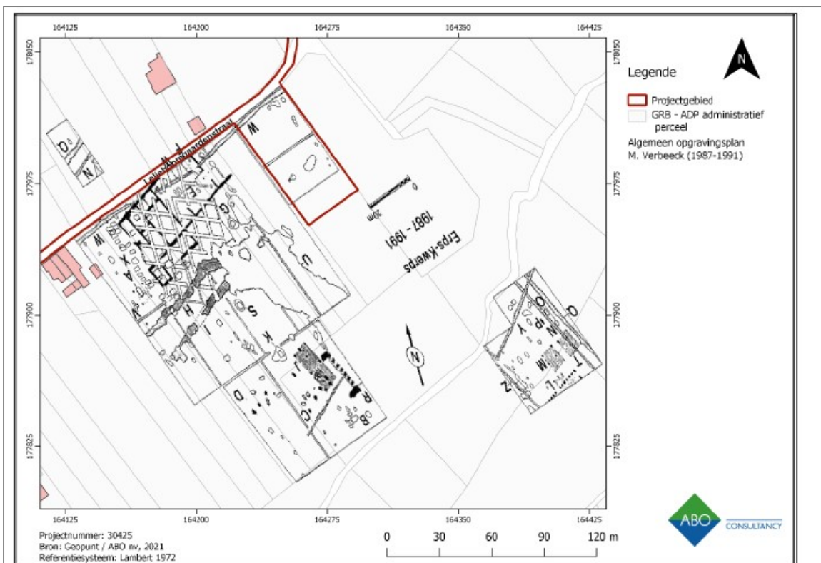
Afb. 22: plan uit de archeologienota met de foutief geprojecteerde site van Verbeek. De rode rechthoek toont deze site uitgerokken over het volledige perceel voor grondverbetering.