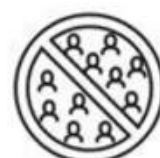
Volg de regels over bijeenkomsten

Diezelfde blik geldt voor de 10 geboden. Het blijft een nuttige algemene insteek om waar van toepassing met deze 10 geboden rekening te houden ook al zijn regels in sommige gevallen soepeler of zonder beperkingen bij culturele activiteiten.