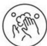
Respecteer de hygiëneregels

Als algemeen principe blijft het nuttig om de aanbevelingen die we het voorbije jaar gehanteerd hebben te volgen. De zes gouden regels blijven in vele gevallen relevant in de samenleving, ook al zijn voor sommige activiteiten de specifieke regels er soepeler of zonder beperkingen bij sommige van de culturele activiteiten.