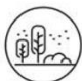
Doe je activiteiten liefst buiten